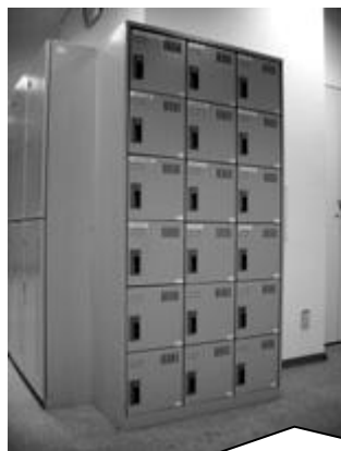
ロッカー（小） 募集個数：18個 幅 258mm 奥行 380mm 高さ 264mm