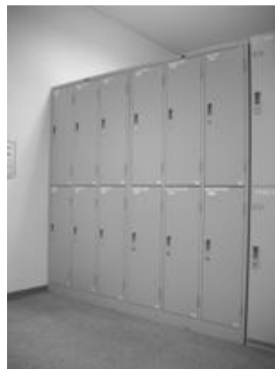
ロッカー（中） 募集個数：23個 幅 300mm 奥行 515mm 高さ 890mm