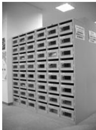
メールボックス 募集個数：96個 幅 245mm 奥行 355mm 高さ 180mm

原則、ロッカーのご利用は一団体当たり一つとしておりますが、 ロッカー（中）（小）に空きがある場合に限り、ロッカー（大・中・小のいずれか）と一緒に、2つ目のロッカー（中・小いずれか）を御利用いただくことができます！ 詳細は中面をご確認ください。