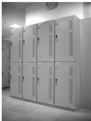
ロッカー（大） 募集個数：36個 幅 450mm 奥行 515mm 高さ 890mm

その機能の1つとして、活動に必要な資料などを保管するための「ロッカー」と、郵便物を受け取ることができる「メールボックス」を提供しています。皆さんの活動に是非御利用ください。